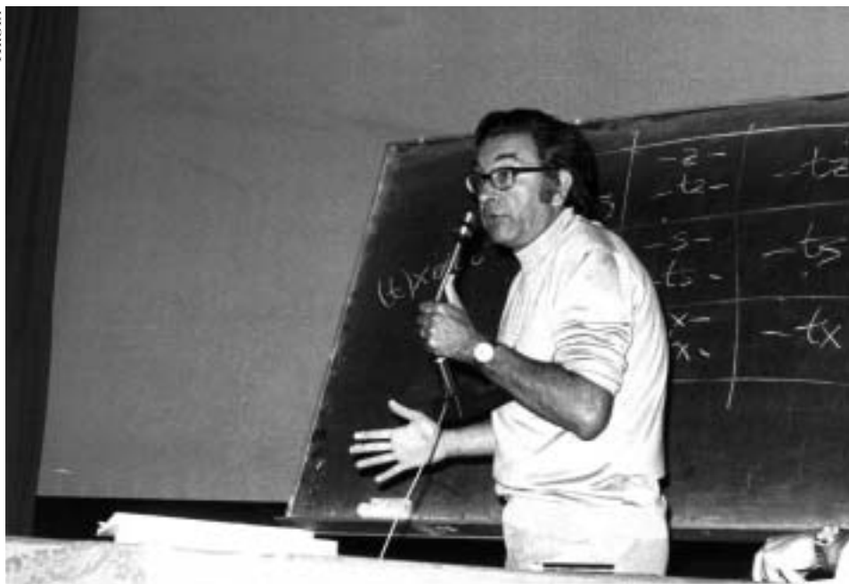
1979an Bergaran, Euskaltzaindiaren VIII. biltzarrean.