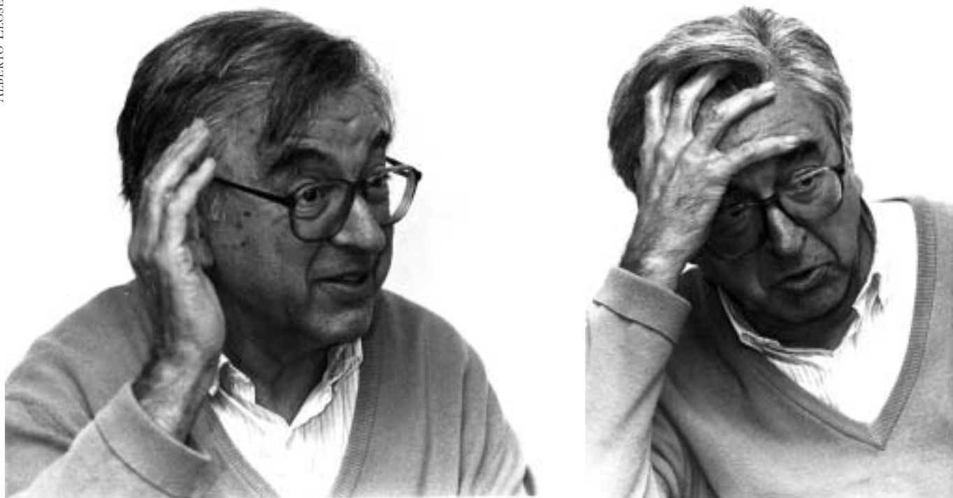
1994an ARGIAN egindako elkarrizketa bateko argazkiak.

tan 1947ra arte jendea fusilatu zuten. Gerra bukatu eta segitu egin zuten.