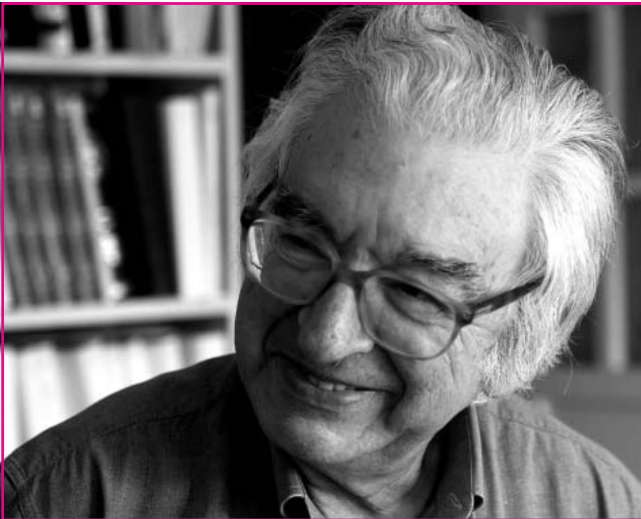
Txillardegui Donostiako Parte Zaharreko etxean.

zela eta... Total, gerra etorri zenean ni gogoratzen naiz etorri berria nintzela Antiguara.